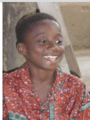
Après traitement et guéri !