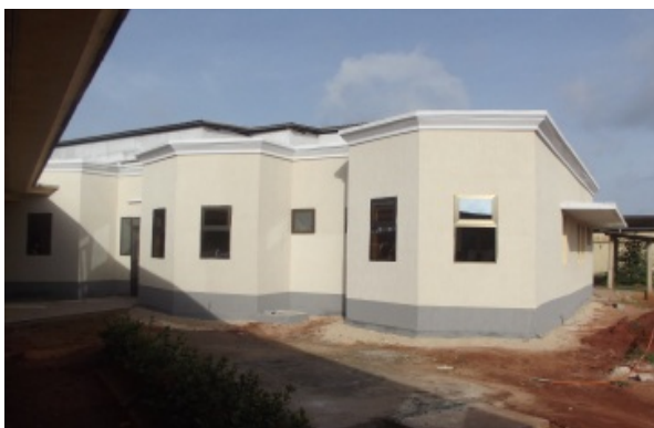
Avec l'aide de IO domani, FIAGOP