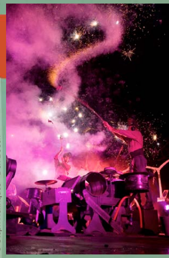
© Steph Henriques - Den Bosch